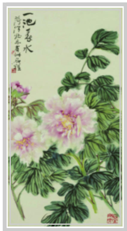
一池春水 陆抑非 绘