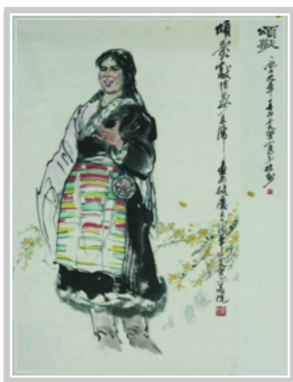
颂歌 李震坚 绘