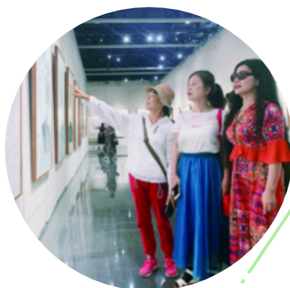
艺术爱好者们欣赏画作