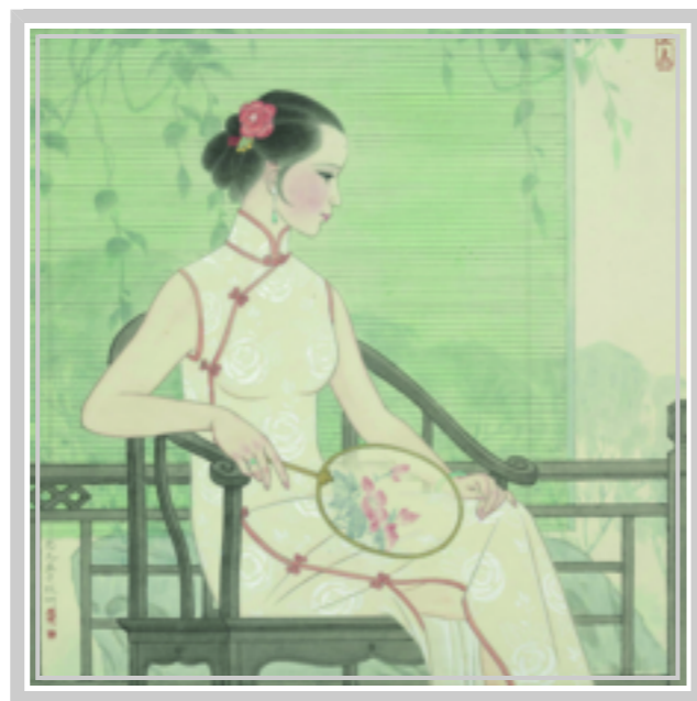
闲庭消暑 宋忠元 绘