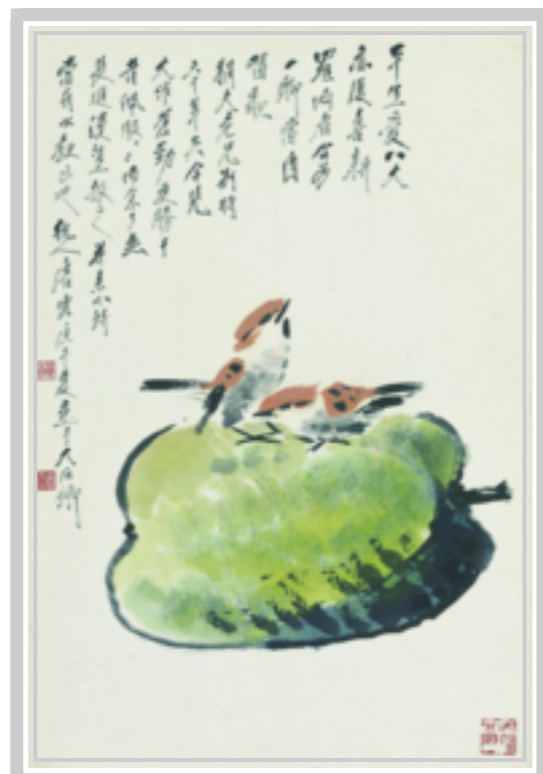
瓜雀 唐云 绘