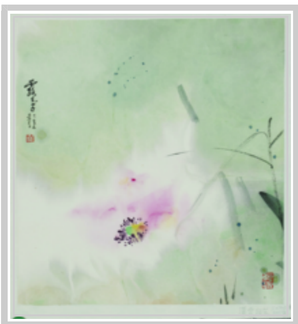
薄雾轻笼 竺庆有 绘